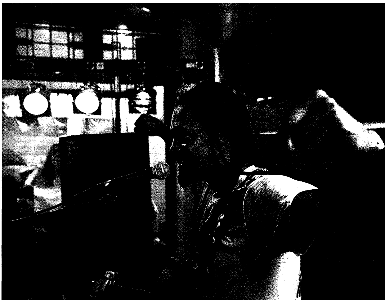
Michael Franti tijdens zijn exclusieve soloconcert bij de Coffee Company in de Amsterdamse Pijp: ook buiten in de regen luisteren mensen

‘De blikken van de soldaten in Irak waren veelbetekenend: wie is die vent? Hadden ze Jessica Simpson niet kunnen sturen?’